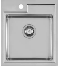
Lavello Fortyfour 4151 050